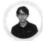
วิทยากรบรรยาย