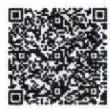
เอกสารแนบ

กองสิ่งแวดล้อมท้องถิ่น กลุ่มงานสิ่งแวดล้อม โทร. ๐๒ ๒๔๑ ๙๐๐๐ ต่อ ๒๑๑๒