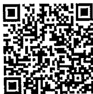
แบบรับรองข้อมูล