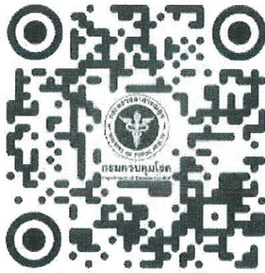
QR code ลงนามปฏิญาณตน