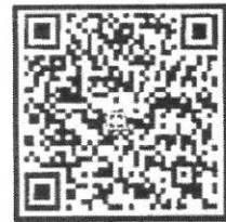
สมาคมวิศวกรรมสิ่งแวดล้อม แห่งประเทศไทย