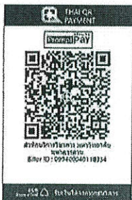
สแกน QR Code เพื่อชำระค่าลงทะเบียน

๑๐.๒ “สแกน QR Code” ผ่านทางแอปพลิเคชัน Mobile Banking