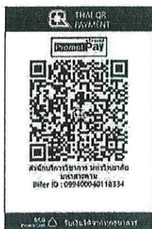
สแกน QR Code เพื่อชำระค่าลงทะเบียน

๒. “สแกน QR Code” ผ่านทางแอปพลิเคชัน Mobile Banking