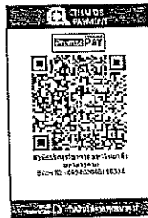
สแกน QR Code ชำระค่าลงทะเบียน