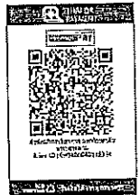
สแกน QR Code ชำระค่าลงทะเบียน

ชำระด้วยเครื่องรูดบัตรอิเล็กทรอนิกส์ (เครื่อง Electronic Data Capture : EDC)และระบบ QR Code