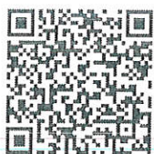
REST-MSU68 รุ่น 3

รับสมัครทางเว็บไซต์โครงการ https://copag.msu.ac.th/slzd/ และทาง QR code โครงการ (ตลอด 24 ชั่วโมง ไม่เว้นวันหยุดราชการ)