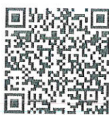
REST-MSU68 รุ่น 4