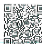
REST-MSU68 รุ่น 6