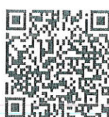
REST-MSU68 รุ่น 5